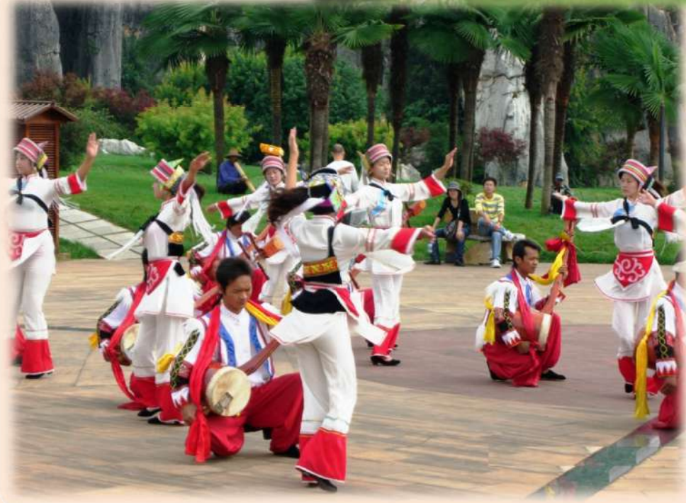
奇岩巡りは少数民族の艶やかな舞踊の鑑賞で締めくくられた。