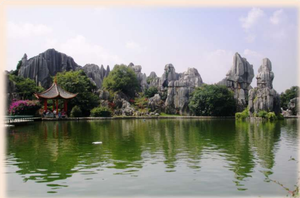
湖と奇岩からなる華麗な庭園風景