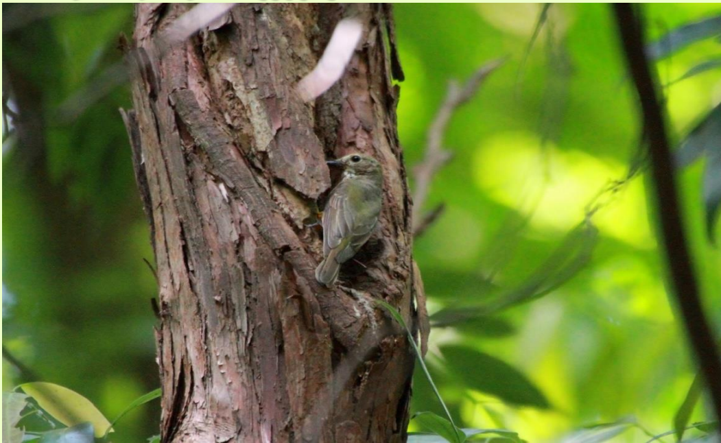
「キビタキの雌」が雛に餌を与えるところです。